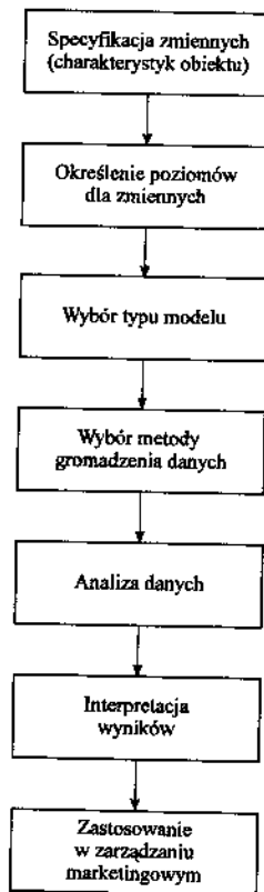
Rys. 4.3. Typowa procedura metody pomiaru łącznego oddziaływania zmiennych

Na podstawie wyróżnionych charakterystyk oraz odpowiadających im poziomów tworzy się zbiór hipotetycznych produktów. Ich liczba jest iloczynem liczby poziomów wyróżnionych dla wszystkich charakterystyk produktów. Dla przykładu z oponami samochodowymi, które zostały opisane